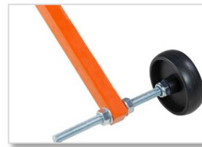
Guía de corte delantera