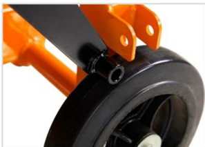
Freno de estacionamiento.