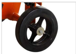
Grandes ruedas traseras