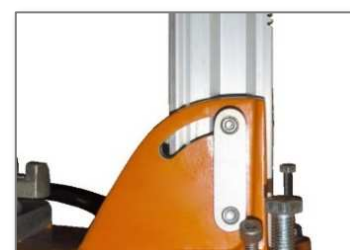
Perforación en ángulo hasta 45°