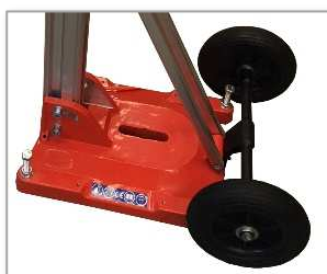
Ruedas de transporte