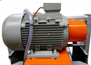
Potente motor de 5,5kw