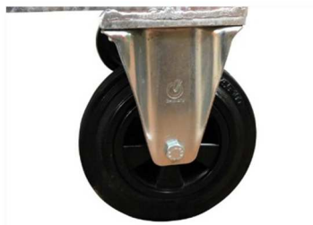
4 ruedas de transporte, 2 con freno de estacionamiento