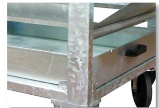
Bañera de agua extraíble recubierta de zinc