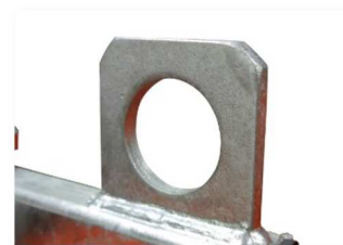
Ganchos de elevación para grua