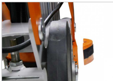
Rectificado y pulido cerca de la pared.