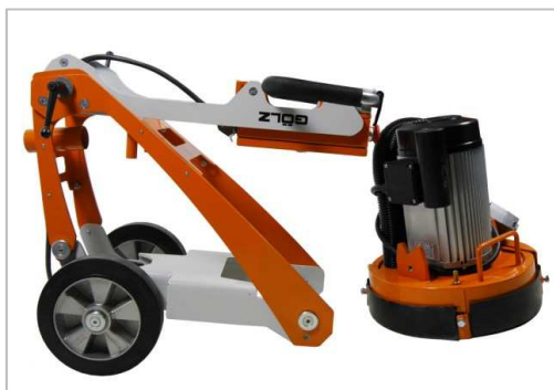
Estructura plegable y divisible en partes