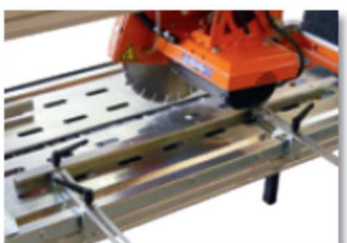
Soporte lateral del material (Accesorio)