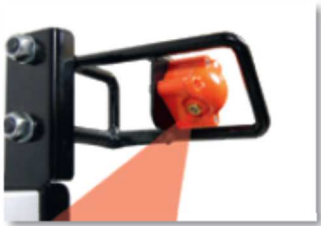
Guía de corte con dispositivo láser