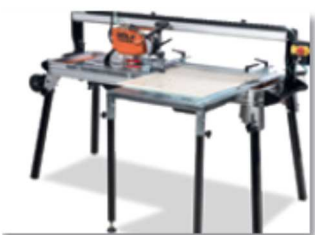
Extensión mesa de trabajo (Accesorio)