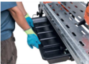
Bañera de agua extraíble. Fácil de limpiar.