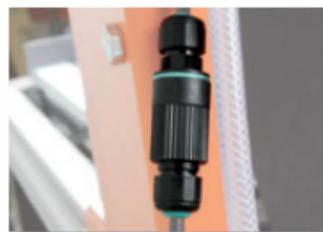
Acoplamiento rápido de la bomba de agua.