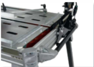
Asas de transporte