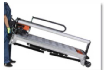
Ruedas de transporte.