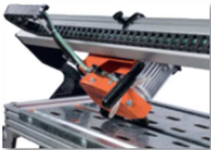
Corte en inglete.